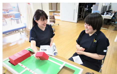
先輩から実践的な臨床指導