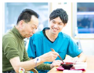
高い専門性を持った作業療法士の育成