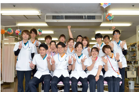
相談しやすい職場の雰囲気